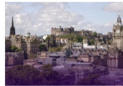
Edinburgh VERENIGD KONINKRIJK