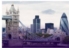
London VERENIGD KONINKRIJK