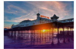
Brighton VERENIGD KONINKRIJK