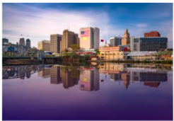
New Jersey VERENIGDE STATEN