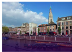
Breda (MK2) NEDERLAND