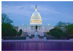
Washington VERENIGDE STATEN